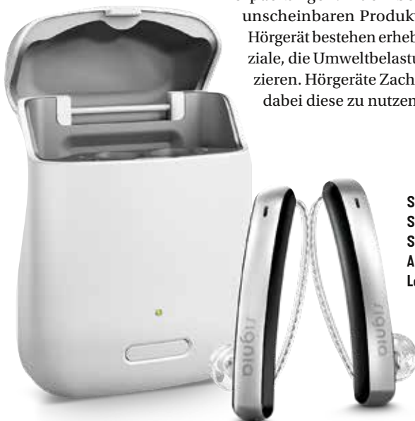
Signia-Pro Styletto: 4 Tage Strom durch Akku in der Ladestation

Akkus statt Batterien, Weiterverwendung vorhandener Geräte, Reduzierung von Plastikverpackungen: Auch bei einem so unscheinbaren Produkt wie einem Hörgerät bestehen erhebliche Potenziale, die Umweltbelastung zu reduzieren. Hörgeräte Zacho hilft Ihnen dabei diese zu nutzen.