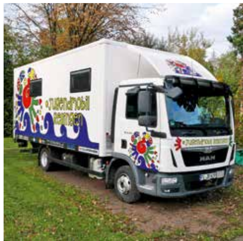
Frischer Auftritt: Das neue Jugendmobil kommt im modernen Style daher