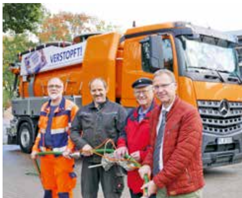
Mächtiger Spülkasten: Der Bauhof begrüßt den dicksten Brummer im Fuhrpark

Die Gemeinde hat kräftig in den Fuhrpark des Bauhofes investiert. Während ein Pritschenwagen und ein Transporter mit Werkstatteinrichtung als Ersatz für altgediente Fahrzeuge dienen, stellt ein schwerer Lkw beim Pressetermin alles andere in den Schatten. Mit diesem Schwergewicht sorgt Rellingen jetzt in Eigenregie für freie Regenwassersiele und Abwasserleitungen. Bisher wurden diese Arbeiten an externe Dienstleister vergeben. Das führte zeitweise zu längeren Wartezeiten und Mängeln an den ausgeführten Arbeiten. Und die Kosten dafür sind so hoch, dass sich das über 400.000 € teure