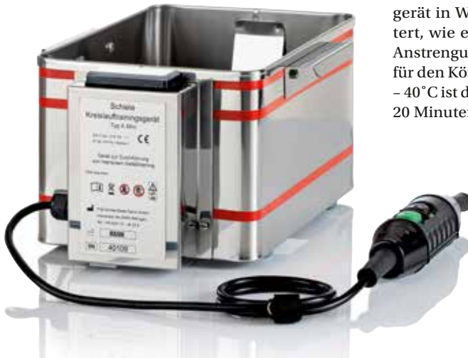
Das Kreislauftrainingsgerät nach Schiele ist in zwei Größen lieferbar.