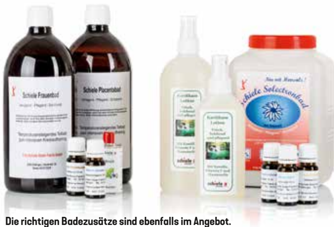
Die richtigen Badezusätze sind ebenfalls im Angebot.