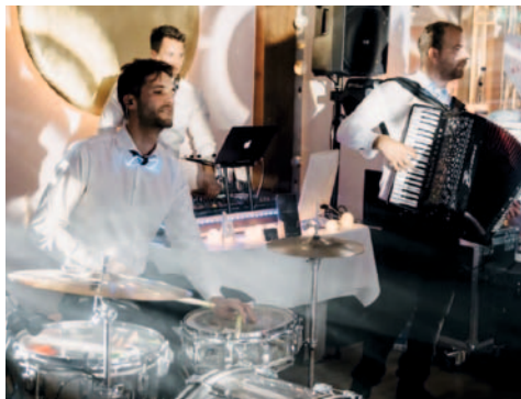
DJ mit Band ist eine besonders kreative Mischung.