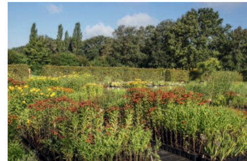
Das Topfquartier Mitte August 2024 mit über 500 verschiedenen Stauden zur Auswahl.

die meist schon über zehn Jahre im Garten gepflanzt stehen. So hat man eine gute Vorstellung, wie erworbene Stauden im eigenen Garten wirken werden. Alle gepflanzten Stauden sind winterhart. Nur die winterharten Fuchsien und Agapanthus erhalten einen Laubschutz im Dezember.