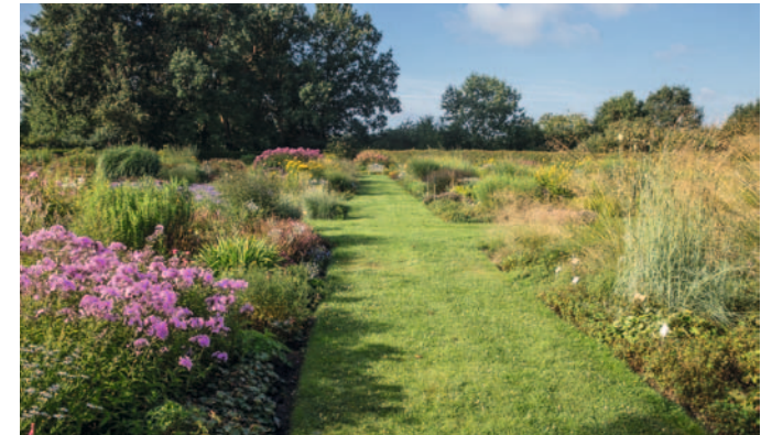
Oben: Der ornamentale Gartenteil in voller Pracht Mitte August 2024.

Beim Besuch im „Garten der Horizonte“ fällt die Auswahl besonders leicht, da hier im Jahreslauf mehr als 1.200 verschiedene Stauden in Wuchs und Blüte zu sehen sind, richtig ausgewachsene Exemplare,