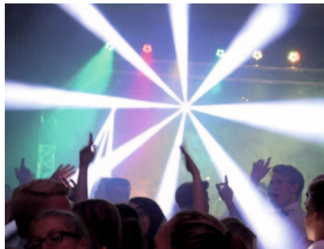
Die Lightshow gehört zum guten Ton.

Bei nord • licht • tones bekommen Sie aber nicht nur auf die Ohren, auch das Auge „hört“ mit. Die Dekoration, das Licht und die passende Show können auch mit angeboten werden.