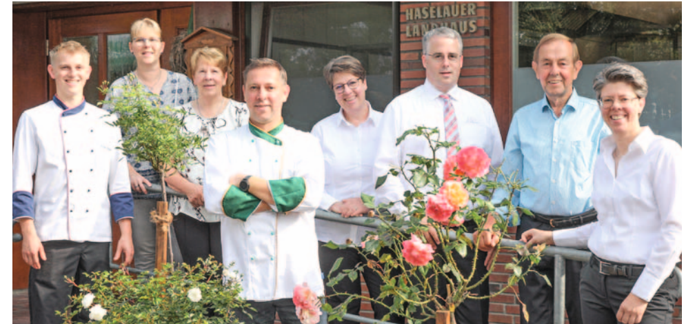
Eine Familie, drei Namen: Lienau, Dettling und Mohr führen den Betrieb jetzt in der 11. Generation:

Der schöne, frisch modernisierte Festsaal bietet genügend Raum für die verschiedensten Veranstaltungen, Feste oder Hochzeiten.