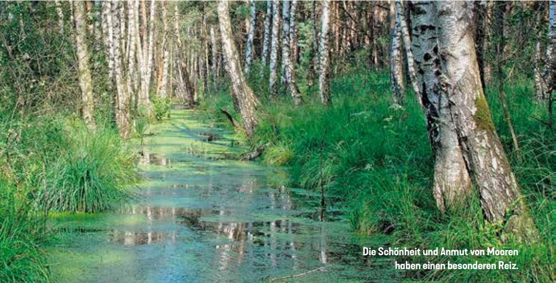
Die Schönheit und Anmut von Mooren haben einen besonderen Reiz.

Moore – verwunschen, gruselig, düster. So werden sie oftmals im Fernsehen, vor allem in Krimis, dargestellt. Doch Moore sind etwas viel Besseres. Sie sind nicht nur Lebensräume für ganz besondere Pflanzen- und Tierarten, sie werden heutzutage auch als Naherholungsgebiete genutzt und sind zudem bedeutsame Player im Bereich des Klimawandels. Denn Moore können auf der einen Seite ein effektiver CO 2 -Speicher sein, auf der anderen Seite aber auch zu einer CO 2 -Quelle werden.