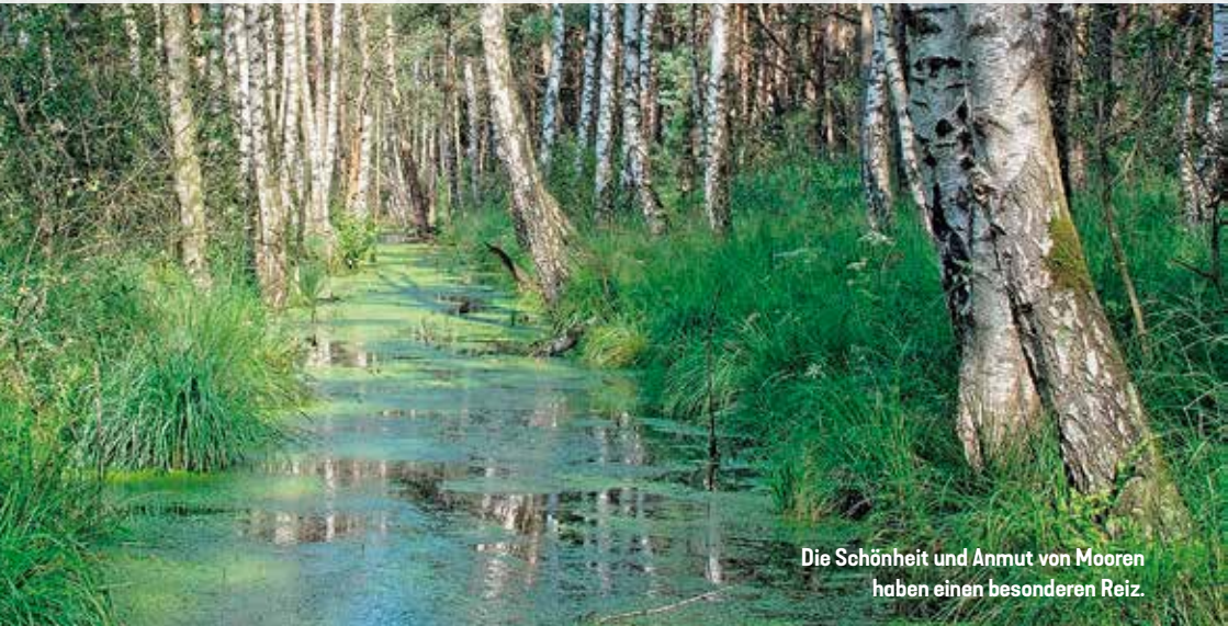
Die Schönheit und Anmut von Mooren haben einen besonderen Reiz.

Moore – verwunschen, gruselig, düster. So werden sie oftmals im Fernsehen, vor allem in Krimis, dargestellt. Doch Moore sind etwas viel Besseres. Sie sind nicht nur Lebensräume für ganz besondere Pflanzen- und Tierarten, sie werden heutzutage auch als Naherholungsgebiete genutzt und sind zudem bedeutsame Player im Bereich des Klimawandels. Denn Moore können auf der einen Seite ein effektiver CO 2 -Speicher sein, auf der anderen Seite aber auch zu einer CO 2 -Quelle werden.