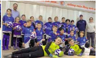
Wer soll diese Mannschaft noch schlagen?