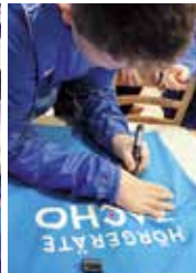
Wie bei den Großen: Autogrammstunde