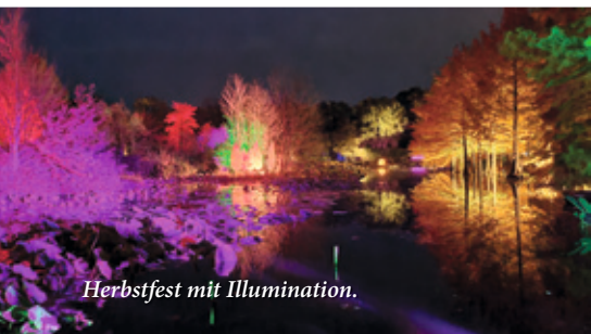
Herbstfest mit Illumination.