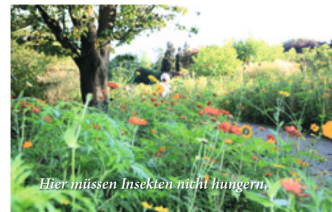
Hier müssen Insekten nicht hungern.