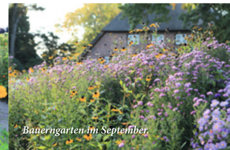
Bauerngarten im September.