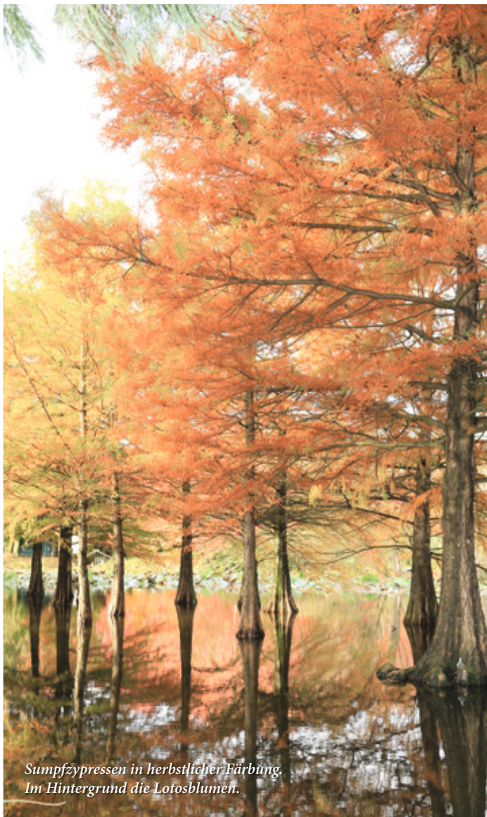
Sumpfyzypressen in herbstlicher Färbung. Im Hintergrund die Lotosblumen.

Der Park ist in verschiedene Themenbereiche gegliedert, so dass es nie langweilig wird – auch für die Kleinen nicht. Vom Bauerngarten am Beginn des