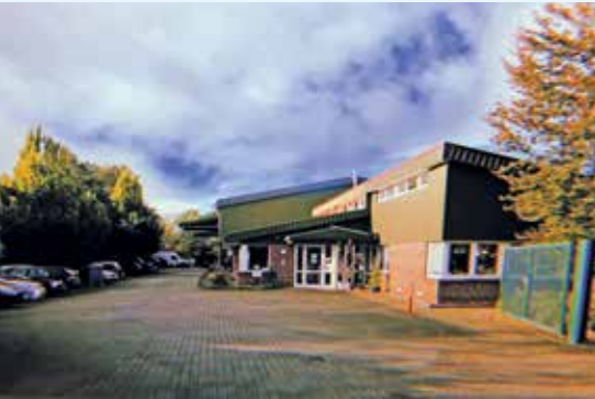
Heidehofweg: Die erste Adresse in Tangstedt

Lagerfläche an. 1998, kurz vor seinem 70. Geburtstag, übergibt der Vater die Geschicke der Hans Conzen Kosmetik in die Hand des Sohnes. „Eine der ersten Entscheidungen war der Neubau des ersten eigenen Firmensitzes am Hamburger Stadtrand in Tangstedt: Größer, moderner und natürlich auf weiteres Wachstum ausgerichtet.“ Im Jahr 2000 erzielten die 14 Kolleginnen und Kollegen im Außendienst 4 Millionen Euro Umsatz. Das erste Mal wurde eine Marketing-Stelle geschaffen und ein Studio-Salon in Hamburg eingerichtet. 2006 wurde das Sortiment um die GLYNT SHADOWS Haarfarben ergänzt. „Von diesem Zeitpunkt an waren wir Komplettanbieter, erstmals konnte ein Salon mit uns als einzigem Lieferanten auskom-