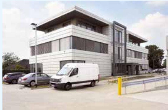
Lehmkoppel: Firmensitz seit Sommer 2016

Lagerfläche an. 1998, kurz vor seinem 70. Geburtstag, übergibt der Vater die Geschicke der Hans Conzen Kosmetik in die Hand des Sohnes. „Eine der ersten Entscheidungen war der Neubau des ersten eigenen Firmensitzes am Hamburger Stadtrand in Tangstedt: Größer, moderner und natürlich auf weiteres Wachstum ausgerichtet.“ Im Jahr 2000 erzielten die 14 Kolleginnen und Kollegen im Außendienst 4 Millionen Euro Umsatz. Das erste Mal wurde eine Marketing-Stelle geschaffen und ein Studio-Salon in Hamburg eingerichtet. 2006 wurde das Sortiment um die GLYNT SHADOWS Haarfarben ergänzt. „Von diesem Zeitpunkt an waren wir Komplettanbieter, erstmals konnte ein Salon mit uns als einzigem Lieferanten auskom-