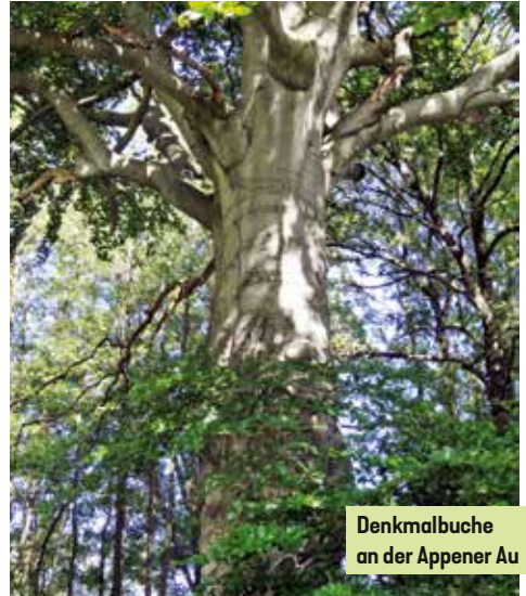
Denkmalbuche an der Appener Au

Der alte Baum muss weichen, zu umfangreich die Krone, die zu arg gestutzt, an Aussehen extrem leidet, also lieber weg damit! Nur bitte nichts überstürzen mit der Einführung weiterer Neophyten! Arten des trockenheißen Balkans wie Traubeneiche, Weißbuche, Weißdorn und Vogelbeere sind in Norddeutschland beheimatet. Warum nicht vorläufig sie mit ihrem besonderen Potenzial erstmal für Neuanpflanzungen favorisieren?