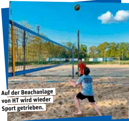
Auf der Beachanlage von HT wird wieder Sport getrieben.