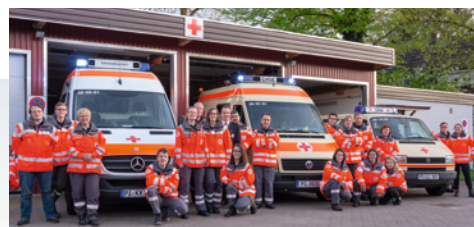
Die Bereitschaft des DRK OV Uetersen e.V. umfasst rund 40 Helferinnen und Helfer, inkl. Reiterstaffel mit 14 Reiterinnen.

Text: Florian Schlüter · DRK-Ortsverein Uetersen e.V. E.-L.-Meyn-Straße 1 · T. 04122 2164 · www.drk-uetersen.de