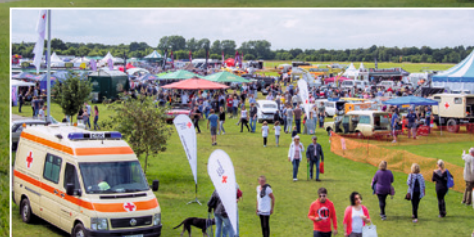
Sanitätswachdienst beim Wingsand'Wheels Festival auf dem Flugplatz Uetersen/Heist