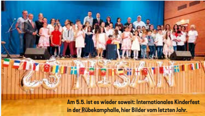
Am 5.5. ist es wieder soweit: Internationales Kinderfest in der Rübekamphalle, hier Bilder vom letzten Jahr.