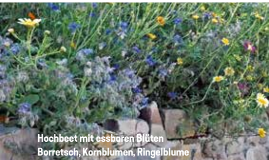
Hochbeet mit essbaren Blüten Borretsch, Kornblumen, Ringelblume