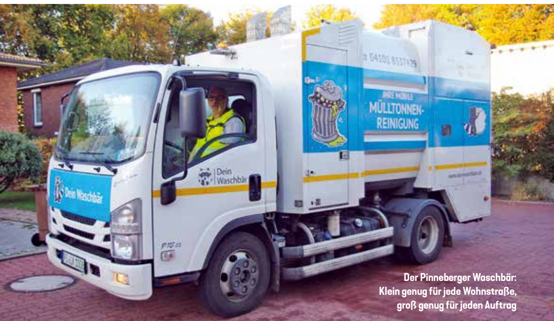
Der Pinneberger Waschbär: Klein genug für jede Wohnstraße, groß genug für jeden Auftrag