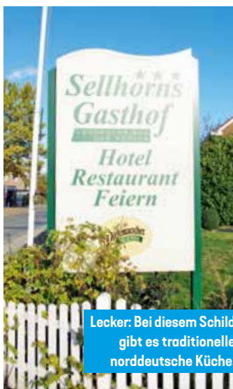
Lecker: Bei diesem Schild gibt es traditionelle norddeutsche Küche.

Und dann ist da noch die Kegelbahn. Bei heute 25 aktiven Vereinen, statt der früheren 45, findet sich