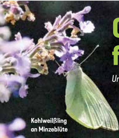
Kohlweißling an Minzeblüte