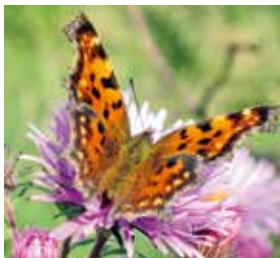
C-Falter auf Herbstaster